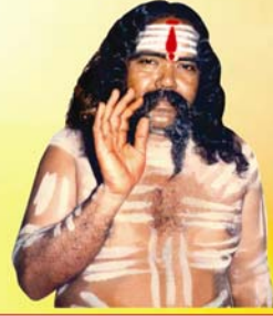
12வது பதினெண்சித்தர் பீடாதிபதி