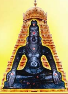
11வது பதினெண்சித்தர் பீடாதிபதி