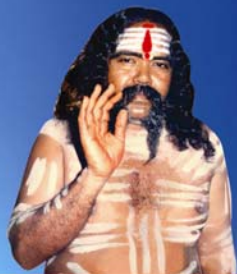
12வது பதினெண்சித்தர் பீடாதிபதி