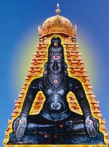
11வது பதினெண்சித்தர் பீடாதிபதி