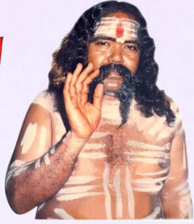
11வது பதினெண்சித்தர் பீடாதிபதி