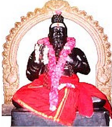
12வது பதினெண்சித்தர் பீடாதிபதி

12வது பதினெண்சித்தர் பீடாதிபதி ஞாலகுரு சித்தர் அரசயோகிக் கருவூரர் அவர்கள் அருளியவை