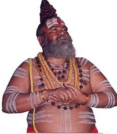
12வது பதினெண்சித்தர் பீடாதிபதி

12வது பதினெண்சித்தர் பீடாதிபதி ஞாலகுரு சித்தர் அரசயோகிக் கருவூரர் அவர்கள் அருளியவை