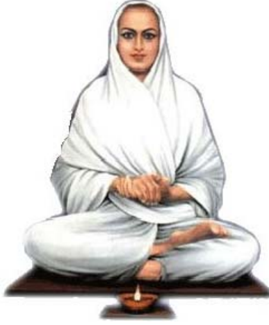
வடலூர் இராமலிங்க அடிகளார்