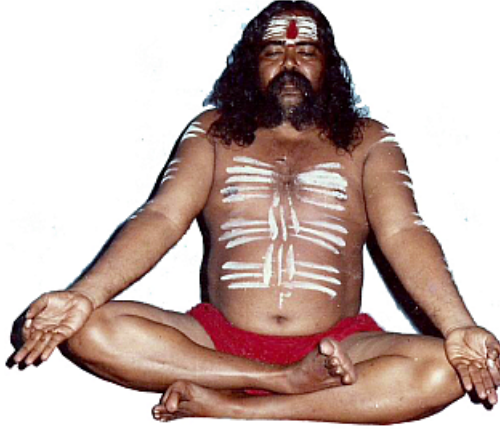
12வது பதினெண்சித்தர் பீடாதிபதி

12வது பதினெண்சித்தர் பீடாதிபதி ஞாலகுரு சித்தர் அரசயோகிக் கருவூரர் அவர்கள் அருளியவை