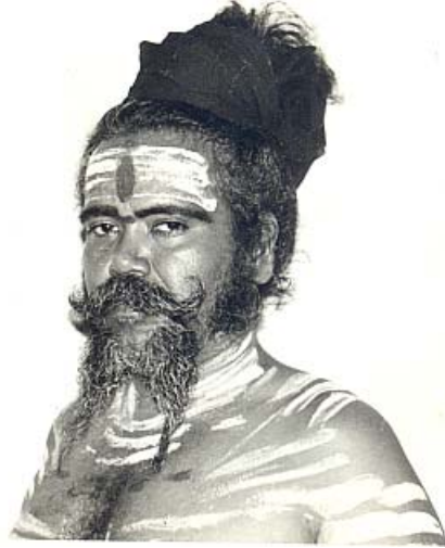
12வது பதினெண்சித்தர் பீடாதிபதி