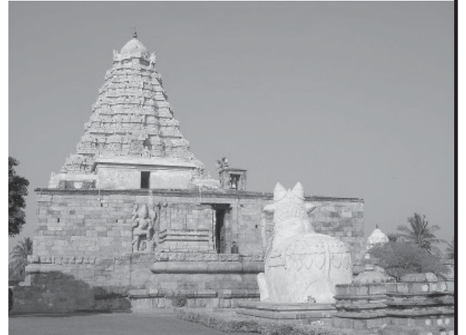
கங்கைகொண்ட சோழபுரக் கோயில் - சிவ இலிங்கத்திற்காகக் கட்டப்பட்ட கோயில்