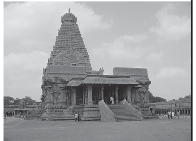
தஞ்சைப் பெரிய கோயில் - சத்தி இலிங்கத்திற்காகக் கட்டப்பட்ட கோயில்