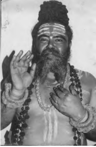
குருதேவர் ஞாலகுரு சித்தர் அரசயோகிக் கருவூரர்