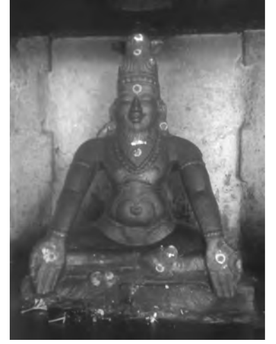
பிற்காலச் சோழப்பேரரசின் தந்தை சித்தர் காவிரியாற்றங்கரைக் கருவூரர்

"பகுத்தறிவு வழி தமிழர் சமயம்" "தமிழர் மதமே இந்துமதம்" "இந்துமதம் ஒரு பகுத்தறிவு மதம்" "தமிழின எழுச்சிக்கு மத மறுமலர்ச்சியே வழி"