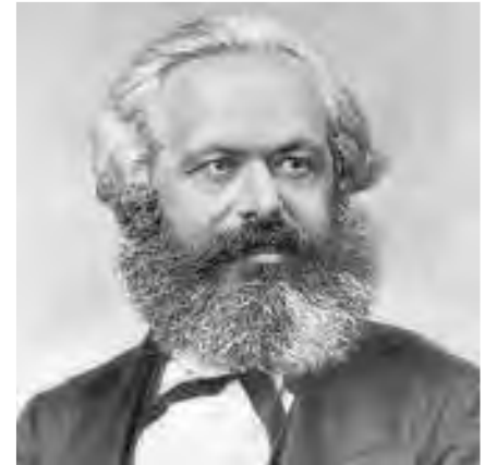
நவநாதசித்தர் என்ற சிறப்பினைப் பெற்ற காரல் மார்க்சு