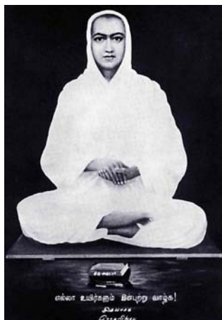
தாத்தா வடலூர் இராமலிங்க அடிகளார்