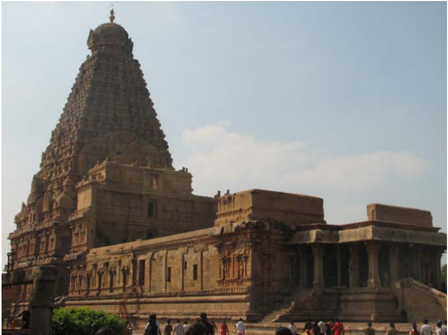
கருவறைக் கோபுரம் கொண்ட தஞ்சைப் பெரிய கோயில்