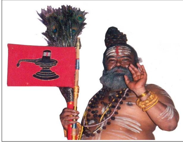
12வது பதினெண்சித்தர் பீடாதிபதி

12வது பதினெண்சித்தர் பீடாதிபதி ஞாலகுரு சித்தர் அரசயோகிக் கருவூரர் அவர்கள் அருளியவை