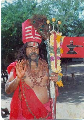
12வது பதினெண்சித்தர் பீடாதிபதி

12வது பதினெண்சித்தர் பீடாதிபதி ஞாலகுரு சித்தர் அரசயோகிக் கருவூரர் அவர்கள் அருளியவை