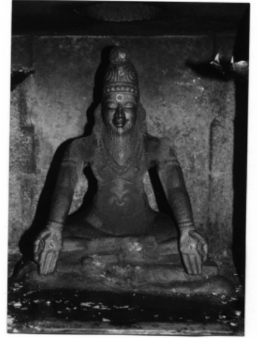
பிற்காலச் சோழப்பேரரசின் தந்தை சித்தர் காவிரியாற்றங்கரைக் கருவூரர்

இந்த இதழில் குருதேவர் உலகியலாக சீடர்களுக்கு அளித்த அறிவுரைகளை உங்களுடன் பகிர்ந்து கொள்ளுகிறோம். இதிலேயே குருதேவர் நாட்டிற்கு நாம் என்ன செய்ய வேண்டும் என்பதை எளிய முறையில் விளக்கி யுள்ளார்.